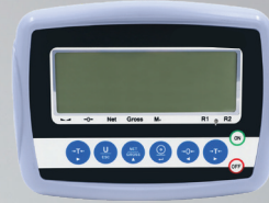
W3 Tartım İndikatörü

TS5 Çukurlu Tip Tır Kantarında kullanmakta olduğumuz W3 tartım indikatörü yüksek hassasiyette 24 bit sigma delta ADC ye sahip, antivibrasyon filtreleme yazılımı ile kararlı tartım özelliklerini barındıran sağlam ve güvenilir tartım indikatörüdür. İki kademeli tartım özelliği ile yasal olarak daha hassas tartım. 1/30000 ADC çevrim hassasiyeti, 26 mm yüksekliğinde arka aydınlatmalı LCD ekran.