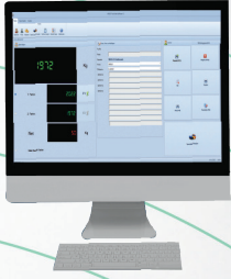
Windows Kantar Programı