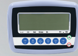
W3 Tartım İndikatörü