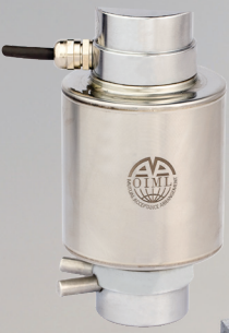
WTL Basma Tipi Yük Hücresi