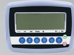
W3 Tartım İndikatörü