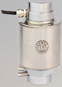
WTL Basma Tipi Yük Hücresi